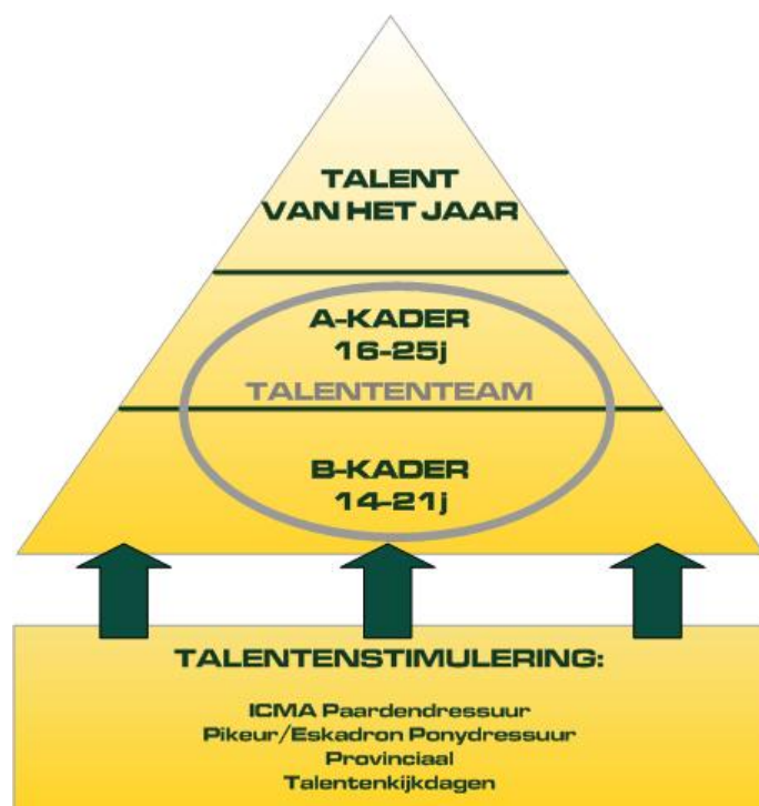
De piramidestructuur van het Talentenplan in 2011.

In het expertenplatform hebben we enerzijds per discipline een groep van sporttechnici, zoals ruiters en trainers. Anderzijds worden deze per discipline aangevuld met de chef d'équipes en coaches van de scholieren, juniors, young riders en seniors. Deze groep van mensen scouten en begeleiden de talenten met het oog op de uitbouw van een sportieve carrière waarbij topsport de einddoelstelling is. Het expertenplatform kwam in 2011 een paar keer samen om in groep te fungeren als denktank rond het ganse VLP-Talentenplan.